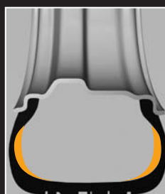
SSR-Pannenlaufreifen Die verstärkten Seitenwände stützen den Reifen bei Luftverlust.