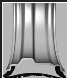
Standard-Reifen Der Reifen wird bei Luftverlust eingeklemmt und zerstört.

Im Gegensatz zu konventionellen Reifen basiert das SSR-Prinzip auf einem Reifen mit selbsttragenden, verstärkten Seitenwänden, die das Fahrzeug auch bei Druckverlust tragen. Dies verhindert im Pannenfall ein Einklemmen der Reifenseite zwischen Straße und Felge.