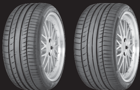
Vorderachse **) / Rundum